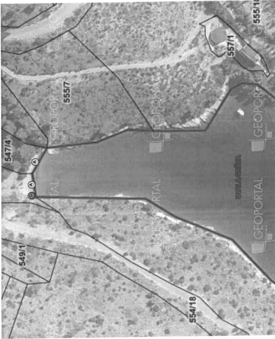
1. Uvala Grška