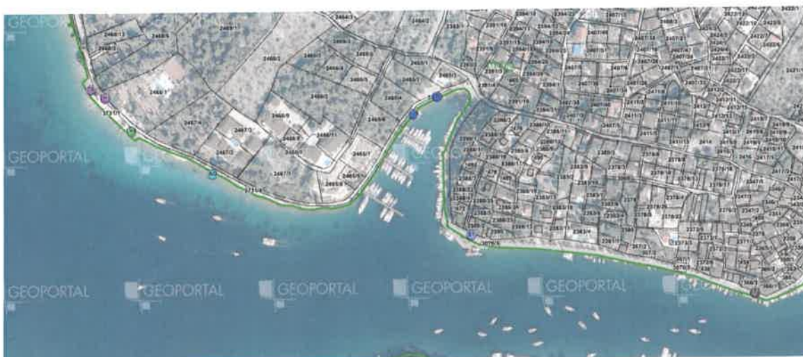
Slika 3 - Milna luka_sjever