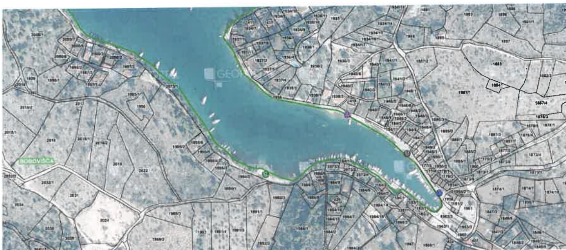
Slika 1 - Bobovišća luka_centar