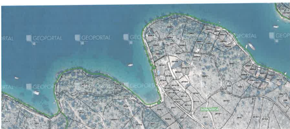
Slika 2 - Bobovišća luka_Mihoj rat