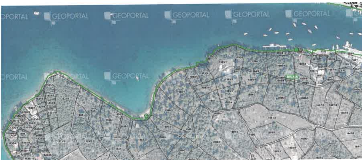
Slika 5 - Milna luka_jug