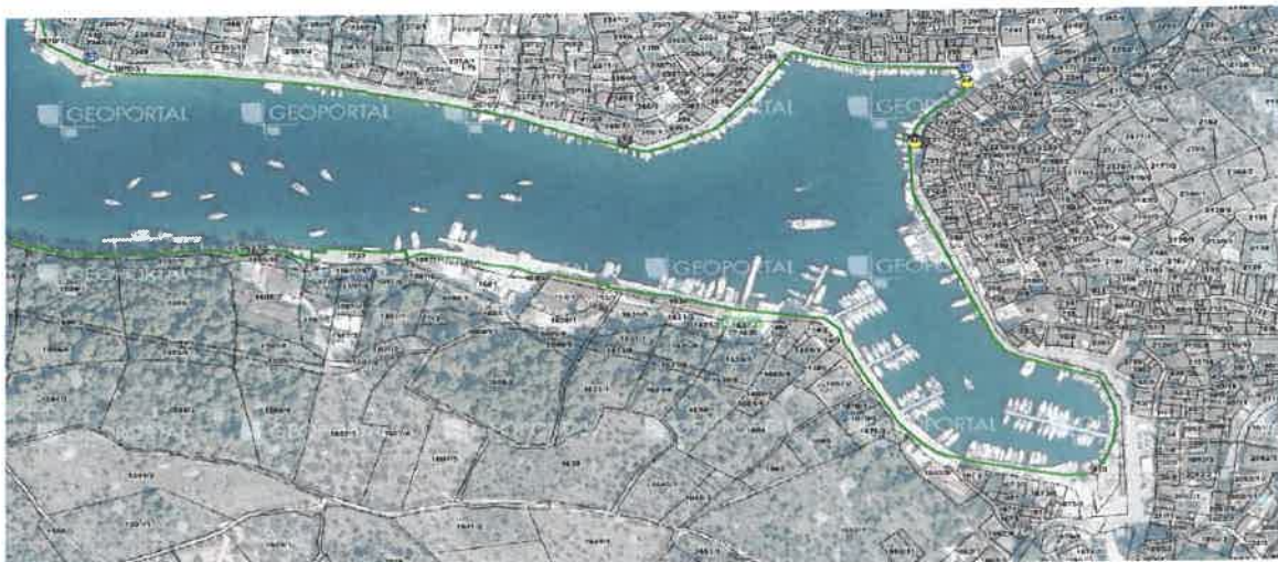
Slika 4 - Milna luka_centar